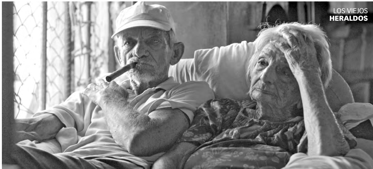
LOS VIEJOS HERALDOS

SI ERES FANÁTICO A LAS HISTORIAS del gran danés que junto a sus amigos resuelve tenebrosos misterios, entonces Scooby-Doo y la maldición de los 13 fantasmas es un banquete para ti. El filme, a la vez que rinde homenaje a la serie de 1985 Los 13 fantasmas de Scooby-Doo , le aporta el cierre, pues esta fue cancelada al año siguiente de su emisión. Después que Fred, Daphne, Vilma, Shaggy y Scooby-Doo arruinaran un caso al atrapar a un hombre inocente, se retiran de sus investigaciones. Sin embargo, al poco tiempo su viejo amigo Vincent Van Ghoul necesita ayuda, por lo que consiguen que el equipo vuelva a la acción. Veranos atrás, Scooby, Shaggy y Daphne cazaron en secreto a 12 de los fantasmas más espeluznantes del mundo, aunque no pudieron atrapar al más malvado de todos. La misión, entonces, es terminar el trabajo. En fin, la típica película de Scooby, que solo disfrutará si eres seguidor de las aventuras de la famosa pandilla de Hanna-Barbera.